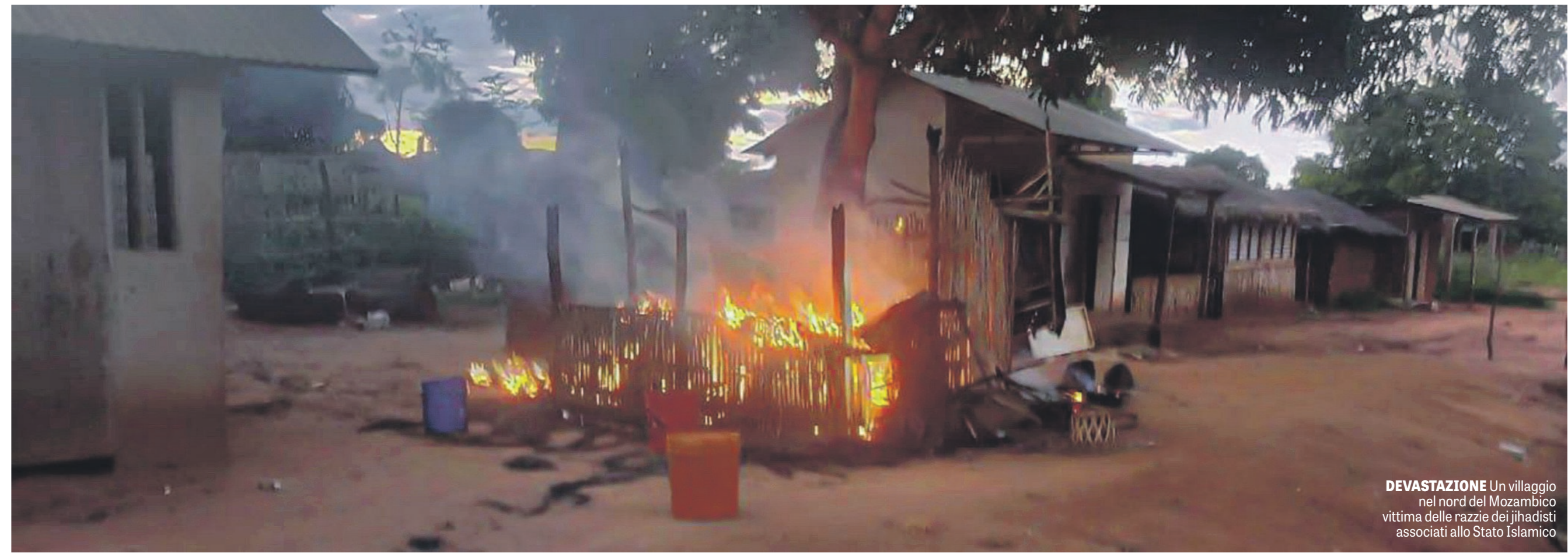
DEVASTAZIONE Un villaggio nel nord del Mozambico vittima delle razzie dei jihadisti associati allo Stato Islamico

enormi risorse naturali, gran parte della popolazione locale continua a vivere in condizioni estremamente difficili, con scarso accesso ai servizi essenziali e poche opportunità economiche. L'avanzata dei gruppi jihadisti ha messo in pericolo anche i grandi investimenti energetici internazionali. Alcuni progetti miliardari sono stati sospesi o rallentati a causa dell'insicurezza crescente, costringendo il governo mozambicano a chiedere supporto militare esterno. L'intervento delle forze straniere ha permesso di ri-