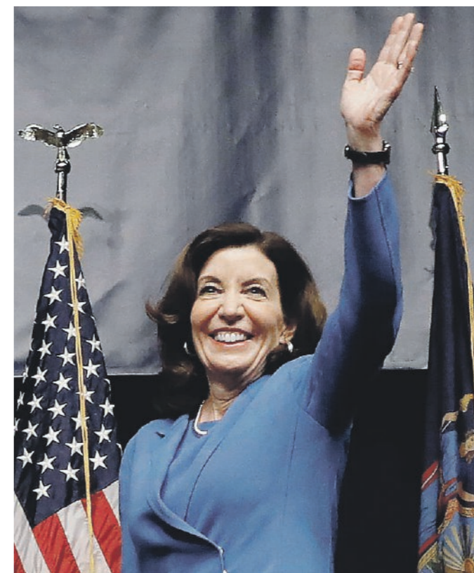
AL VERTICE Kathy Hochul, governatrice dello Stato di New York

Zohran Mamdani ha presentato il primo bilancio della sua amministrazione. Il documento per l'anno fiscale 2026 è in equilibrio, ma per il 2027 è previsto un deficit di circa 5,4 miliardi di dollari. Secondo l'amministrazione, il disavanzo deriva anche da anni di sottostima delle spese durante il mandato dell'ex sindaco Eric Adams , che avrebbe lasciato circa 12 miliardi di dollari di impegni non coperti. La governatrice dello Stato di New York, Kathy Hochul , ha autorizzato 1,5 miliardi di dollari di aiuti statali per contenere il deficit, ma è una goccia nell'oceano. Per ridurre la distanza tra entrate e spese, il sindaco ha proposto una sovrattassa del 2% sui milionari residenti, pari a circa lo 0,7% dei contribuenti. La misura potrebbe generare circa tre miliardi di dollari annui. Tuttavia, la proposta richiede l'approvazione dei legislatori statali e il via libera della governatrice, oltre al voto del consiglio comunale. In caso di mancata autorizzazione, l'amministrazione ha indicato un'alternativa drastica: un aumento del 9,5% dell'imposta sulla proprietà, che colpirebbe soprattutto i contribuenti con redditi medi e bassi.