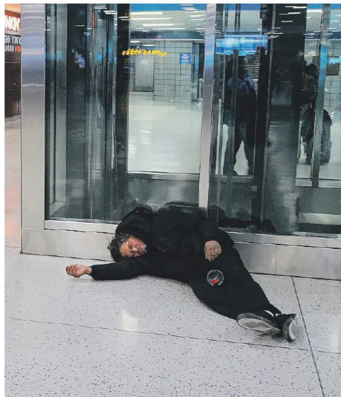
DISAGIO A New York ci sono oltre 158.000 senzatetto

Il primo nodo riguarda proprio la politica abitativa, cuore dell'impegno elettorale. Mamdani aveva promesso interventi decisi per contenere i costi degli alloggi e ampliare i sostegni alle famiglie in difficoltà. In particolare, durante la campagna aveva assicurato