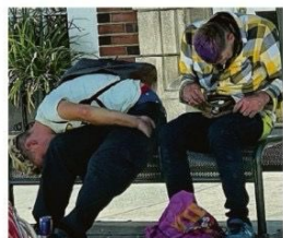
EFFETTO ZOMBIE - Consumatori di Fentanyl negli Stati Uniti

In Europa ogni settimana compare una nuova sostanza psicoattiva. Un business che sta attirando sul continente anche i temibili narcos messicani