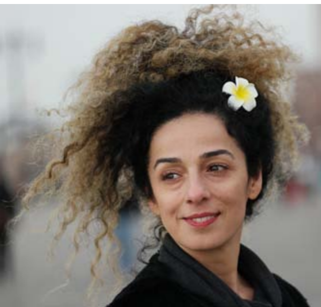
La giornalista e dissidente iraniana Masih Alinejad, vincitrice del Women's Rights Award per «la lotta delle donne iraniane per i diritti umani».

GLI AGENTI MEDIORIENTALI, COME QUELLI DELLA TURCHIA, HANNO AFFINATO LE TECNICHE DI RAPIMENTO