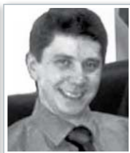
KONSTANTIN VIKTOROVICH KILIMNIK RUSSIA