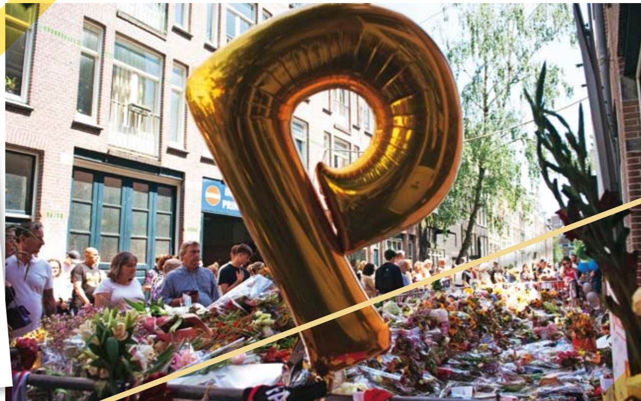
Le manifestazioni di cordoglio ad Amsterdam per la morte del reporter investigativo de Vries.

primi anni Novanta e all'inizio del 21° secolo la polizia si è focalizzata principalmente sul giro di vite delle "reti olandesi". Persone come il rapitore del magnate della birra Freddy Heineken, Willem Holleeder, erano ritenuti obiettivi prioritari, e la polizia si concentrava solo sul loro arresto. Nel frattempo però altri gruppi, spesso piccoli spacciatori nordafricani, sono stati in grado di crescere nell'oscurità e accumulare rapidamente fortune, importando tonnellate di cocaina.