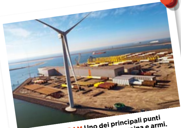
ROTTERDAM Uno dei principali punti di smistamento di cocaina, eroina e armi.

Altro che tulipani e piste ciclabili, i Paesi Bassi sono ormai diventati la patria della delinquenza e dello spaccio di droga. Dove si uccidono non solo le gang rivali, ma pure avvocati, poliziotti e giornalisti che indagano sui traffici illeciti, come dimostra l'ultimo omicidio del reporter Peter R. de Vries. E, da anni, sono anche un comodo rifugio per il terrorismo islamico.