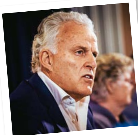
Peter de Vries, 64 anni, il giornalista olandese ucciso lo scorso 15 luglio per le sue indagini sul traffico di droga.