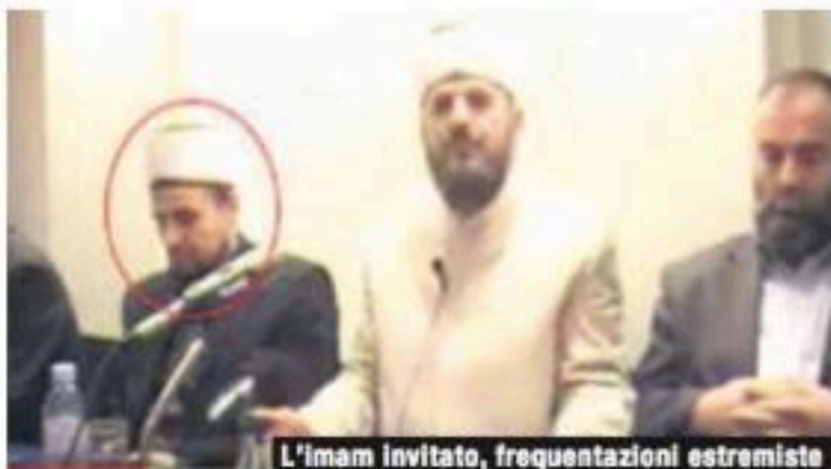
L'Imam invitato, frequentazioni estremiste

clima che ricordava il "maccartismo" americano. Sarebbe drammatico legittimare agli occhi del mondo in casa nostra chi è tanto discusso. Il 1° giugno p.v. all'inaugurazione di Alptransit se davvero si vuole insistere con questa discutibile cerimonia religiosa, si invitino persone libere, trasparenti e con piena legittimazione. Il protagonista di questa strana vicenda al momento tace, non ha ancora avuto il buongusto di chiamarsi fuori. Allora sarebbe bello se lo lasciassero "in panchina" coloro che lo hanno dipinto come un "campione dell'Islam moderato". Per farlo basta una semplice email "egregio signore, la informiamo che l'invito